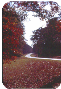
Natchez Trace, Mississippi, 11/2001